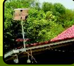
सोलर दिवे ७०% वापरले जातात