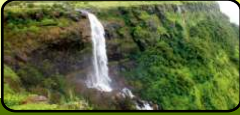
जवळची निसर्गाची उधळण - मढे घाट