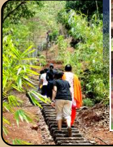
स्वतःच्या जागेत ट्रेकिंग