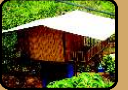
मचान - ट्री हाऊस